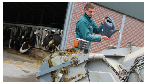
Toevoegen TMR organofresh voor stalvoeren.